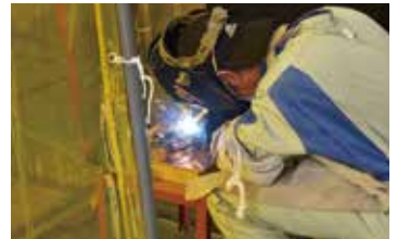
溶接管理責任者制度の創設