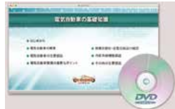
次世代自動車修理に対応する技術情報