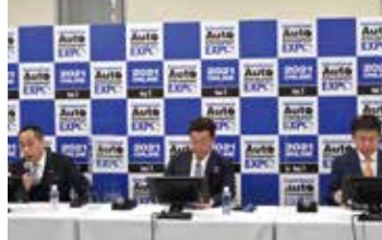
他業界団体との情報交換