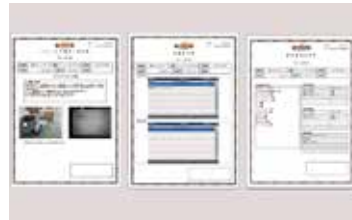
BS エビデンスシステムの構築