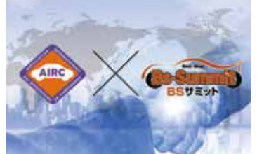
国際車体修理協会への加盟