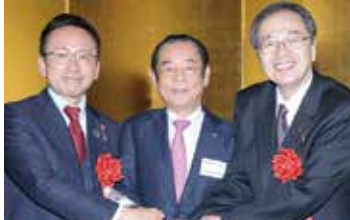
行政機関との意見交換 (2020年1月BSサミット賛詞交歓会にて)

しかし、成熟期を迎えた日本において「これさえやれば」という絶対的な正解はなく、地域性など環境によって必要な情報は異なります。様々な分野・地域で活躍する自動車修理工場が集結する BS サミットだからこそ、次世代自動車時代で勝ち残るために必要な多種多様な情報を得られます。